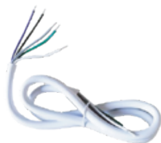
CABLE BLANCO DE 5 HILOS PARA ALIMENTACIÓN DE LUMINARIA LINEAL