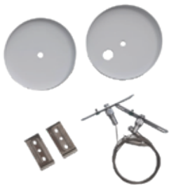
CABLES DE ACERO PARA SUSPENSIÓN LINEAL ARQUITECTÓNICA