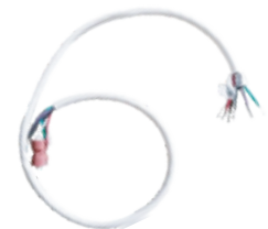
CABLE BLANCO DE 6 HILOS PARA ALIMENTACIÓN DE LUMINARIA LINEAL